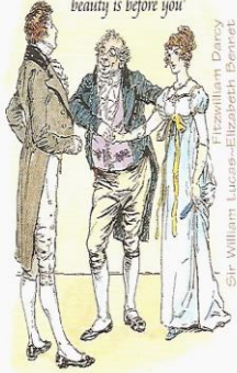
Elizabeth-Darcy Mr. Bingley-Lucase-Elizabeth Bennet

'Mr Darcy, you must allow me to present this young lady to you as a very desirable partner. You cannot refuse to dance...when so much beauty is before you'