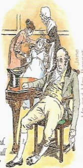
Mr. and Mrs. Bennet

Jane had not been gone long before it rained hard. Her sisters were uneasy for her, but her mother was delighted