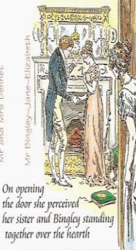
Mr. Bingley-Jane-Elizabeth Bennet

'I never saw any one so shocked. He could not speak a word for full ten minutes'